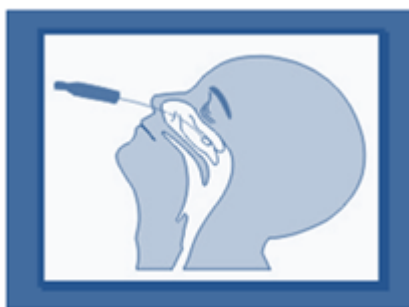
Fig. 2A: Swab Nasal

- Swab de nasofaringe – A coleta deve ser realizada com a fricção do swab na região posterior do meato nasal tentando obter um pouco das células da mucosa (Figura 2A). Coletar swab nas duas narinas (o mesmo swab para as duas narinas).