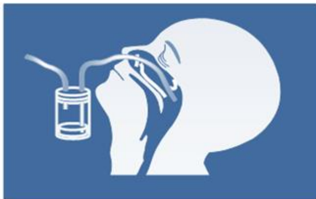
Figura 1: Ilustração da técnica para coleta de aspirado nasofaríngeo